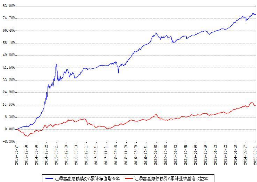
汇添富高息债债券A累计净值增长率与同期业绩基准收益率对比图

(二) 自基金合同生效以来基金累计净值增长率变动及其与同期业绩比较基准收益率变动的比较图