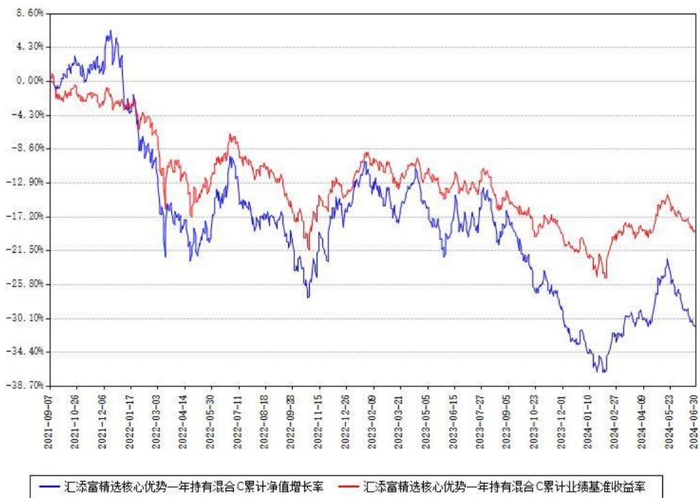
汇添富精选核心优势一年持有混合C累计净值增长率与同期业绩基准收益率对比图